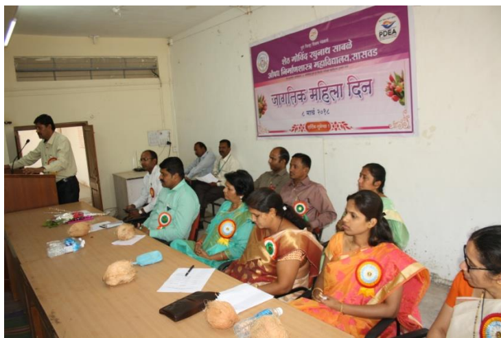
Women's Day Celebration in association with Rotary Club, Saswad